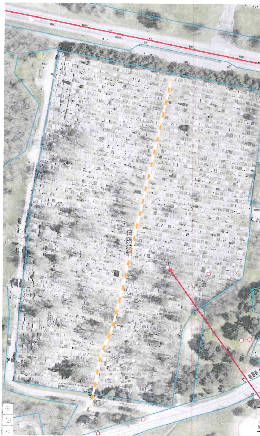
KAAS vieta kapinēse (elektros apskaita)